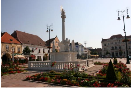
Dreifaltigkeitssäule auf dem Hauptplatz in Tulln