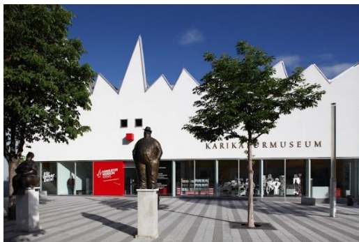
Karikaturmuseum KREMS Museumsplatz 3 3500 KREMS an der Donau Tel.: 02732 908010 office@karikaturmuseum.at https://www.karikaturmuseum.at